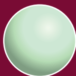
Kugeln Karotten, Süsskartoffeln, Kartoffeln, Melonen, Randen Chioggia, Zucchetti, Birnen