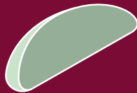
Filet Grapefruits, Limes, Orangen, Zitronen