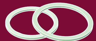
Ringe Echalotten, Lauch, Zwiebeln, Frühlingszwiebeln, gedämpfte Zwiebeln